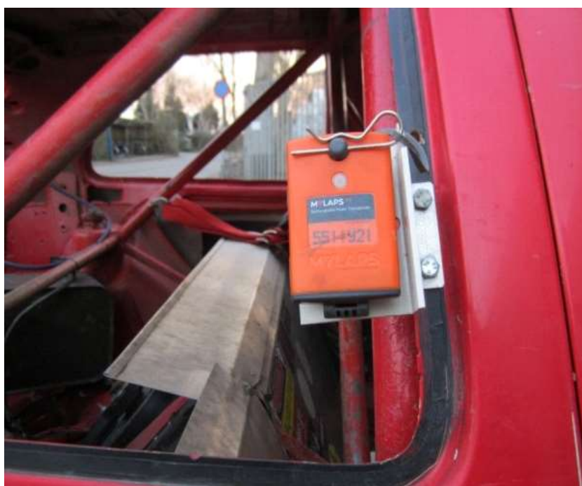
Transponder rechtop monteren